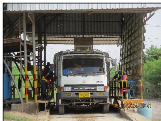
ภาพที่ 2.24 ด้านซังน้ำหนักรถบรรทุกขนส่งแร่