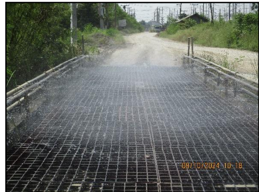
ภาพที่ 2.5 บ่อล้างล้อรถบรรทุกในช่วงถนนคอนกรีตของเส้นทางขนส่งแร่