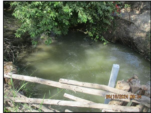
ภาพที่ 2.9 คูระบายน้ำด้านนอกคันทำนบ