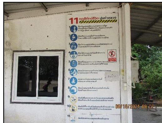
ภาพที่ 2.14 นโยบายความปลอดภัยอาชีวอนามัย และสิ่งแวดล้อมในการทำงาน