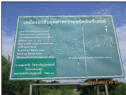
ภาพที่ 2.15 ป้ายประทานบัตร