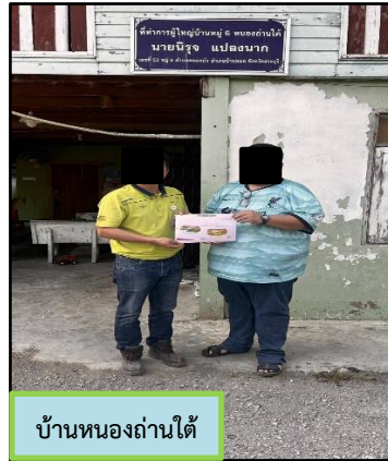
บ้านหนองถ่านใต้