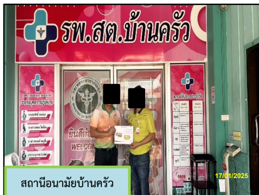
สถานีอนามัยบ้านครัว