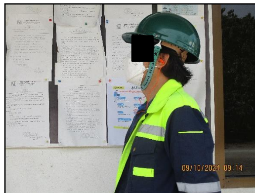
ภาพที่ 2.25 พนักงานสวมใส่อุปกรณ์ป้องกันอันตราย