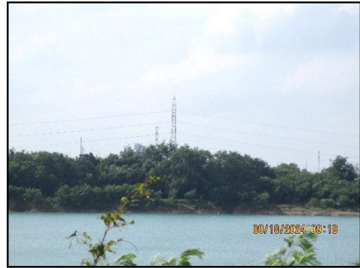
ภาพที่ 2.3 การเว้นระยะห่างจากแนวสายไฟ