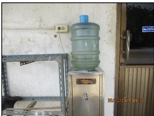
ภาพที่ 2.17 ตู้บริการน้ำดื่มภายในพื้นที่ โครงการ