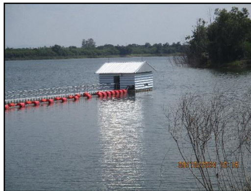
ภาพที่ 2.20 จุดรับน้ำเพื่อนำมาฉีดพรมถนนลำเลียงแร่