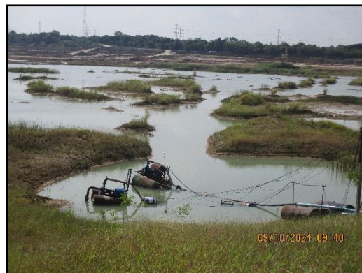
ภาพที่ 2.23 บ่อรวบรวมน้ำ (Sump)