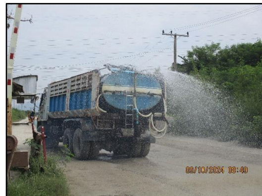
ภาพที่ 2.21 รถบรรทุกน้ำคอยฉีดพรมถนนภายในพื้นที่โครงการ