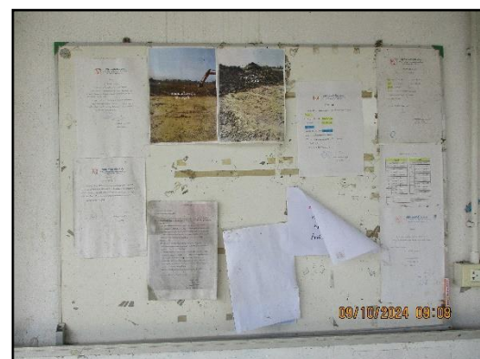
ภาพที่ 2.10 บอร์ดประชาสัมพันธ์ความรู้ต่างๆ ภายในพื้นที่โครงการ