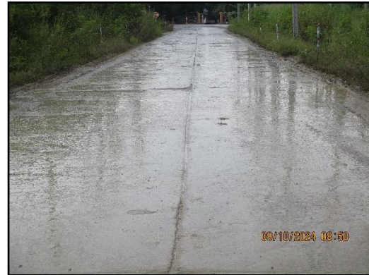
ภาพที่ 2.6 สภาพเส้นทางขนส่งแร่ (ส่วนบุคคล) ช่วงก่อนขึ้นสู่ทางหลวง