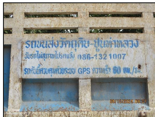
ภาพที่ 2.13 รถบรรทุกที่มีการติดชื่อโครงการ และหมายเลขโทรศัพท์