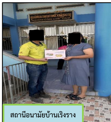
สถานีอนามัยบ้านเรีงราง