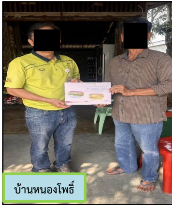
บ้านหนองโพธิ์