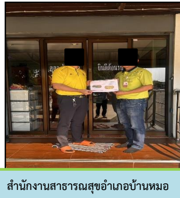
สำนักงานสาธารณสุขอำเภอบ้านหมอ