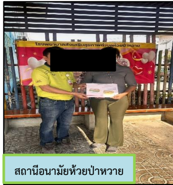
สถานีอนามัยห้วยป่าหวาย