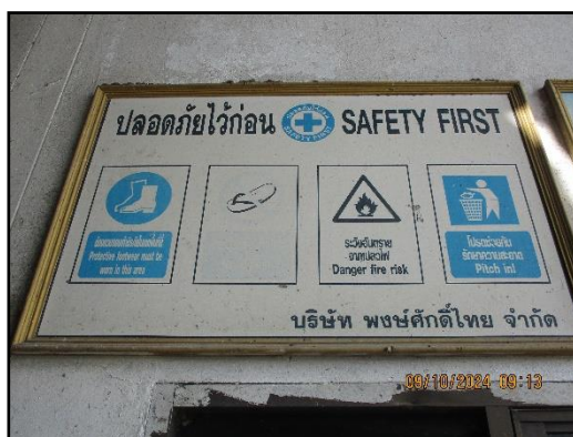
ภาพที่ 2.26 ป้ายเตือนบริเวณที่มีความเสี่ยงและกำหนดให้สวมใส่อุปกรณ์ป้องกันอันตรายส่วนบุคคล