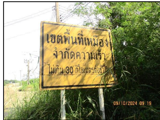
ภาพที่ 2.12 ป้ายจำกัดความเร็วไม่เกิน 30 กิโลเมตร/ชั่วโมง