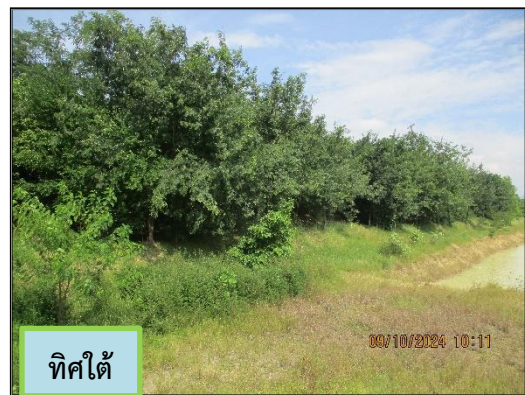
ภาพที่ 2.4 ค้นทำนบดินของพื้นที่โครงการ