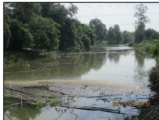
ภาพที่ 2.8 คลองห้วยแร่