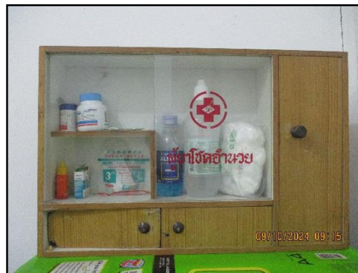
ภาพที่ 2.16 ตู้ปฐมพยาบาลเบื้องต้น ประจำโครงการ