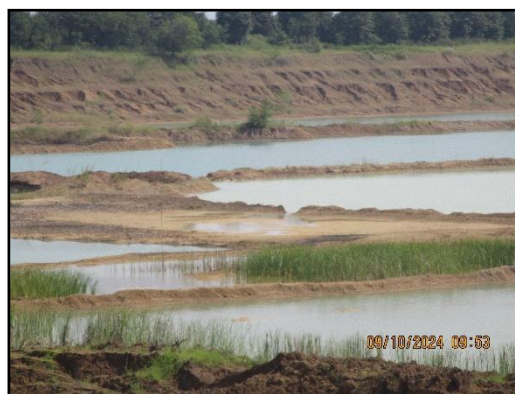
ภาพที่ 2.19 การเปิดหน้าเหมืองในลักษณะขั้นบันได