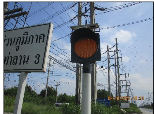
ภาพที่ 2.11 ป้ายจราจร และสัญญาณไฟให้ชะลอความเร็วบริเวณช่วงก่อนเลี้ยวเข้า-ออก พื้นที่โครงการ