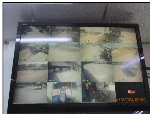
ภาพที่ 2.27 การติดตั้งกล้องวงจรปิดภายในพื้นที่โครงการ