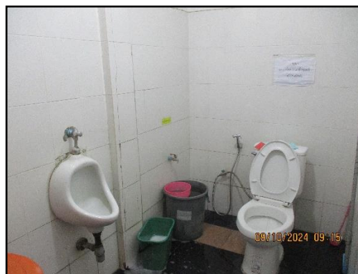
ภาพที่ 2.18 สุขาภายในพื้นที่โครงการ