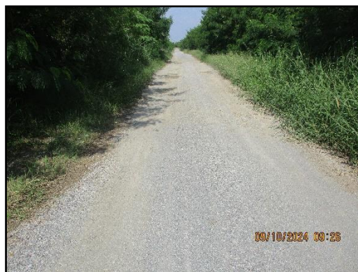
ภาพที่ 2.7 ถนนลาดยางที่เพิ่มไปยังขอบบ่อเหมืองเก่าของโครงการ