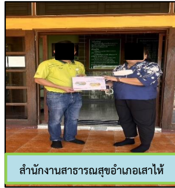
สำนักงานสาธารณสุขอำเภอเส้าไห้