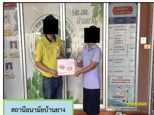
สถานีอนามัยบ้านยาง